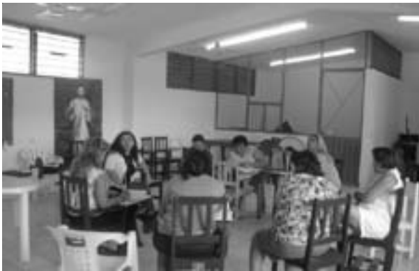
Sesión del Taller de Escritura Femenina en la sala de usos múltiples del Cereso de Mérida