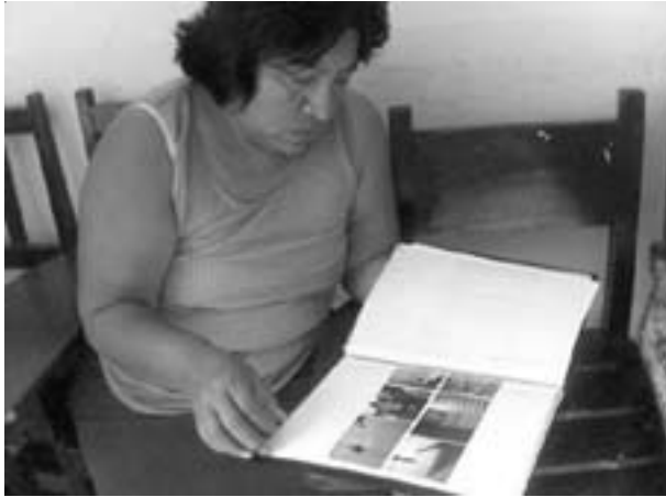
Integrante de la Sala de Lectura Zedík